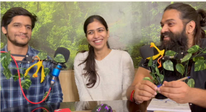
Guy Eats Ghost Pepper During the Podcast